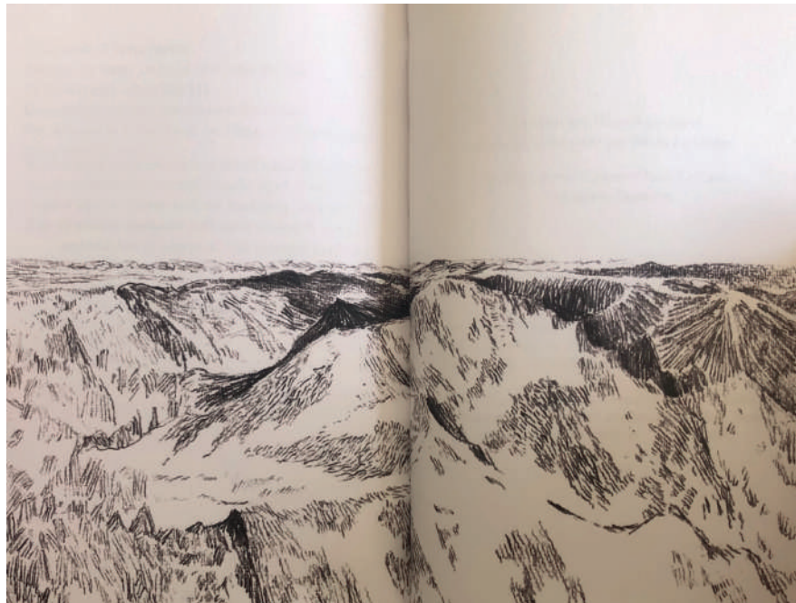
Le Pic du Montcalm. Extrait du recueil. Dessins par Diane-Line Farré.

Le massif ariégeois devient espace d'enquête et lieu d'improvisation. L'épreuve de l'ascension se montre et se fabrique dans le geste du poète. Le recueil devient tentative de poésie ascensionnelle.